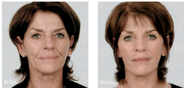
Tratamiento facial completo