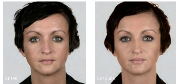
Aumento del volumen de las mejillas y corrección de las ojeras