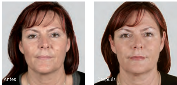
Tratamiento de pliegues naso-labiales, aumento del volumen labial