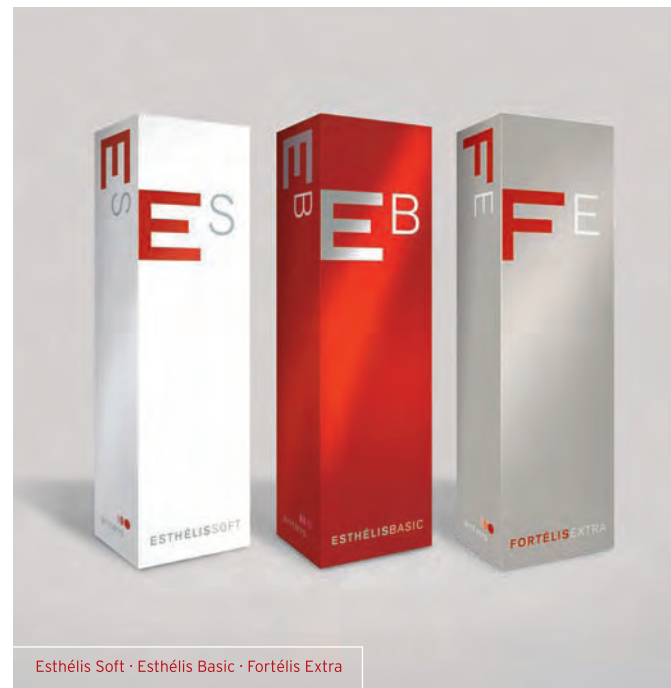
Esthélis Soft · Esthélis Basic · Fortélis Extra